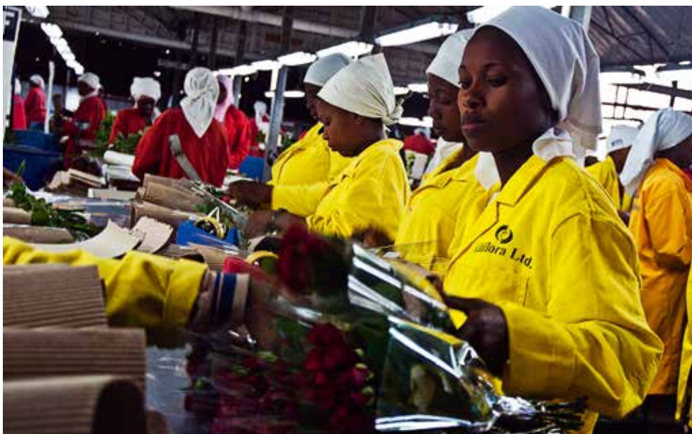
Fra pakkeriet på den Fairtrade-sertifiserte roseplantasjen Kiliflora i Arusha, Tanzania. Foto: Andreas Feen Sørensen 2012

„Det er viktig å fortelle historiene. Ikke bare solsiden, men også om alle utfordringene vi møter underveis.“