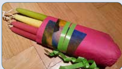
Vakre hånddyppede lys, laget på Helgeseter