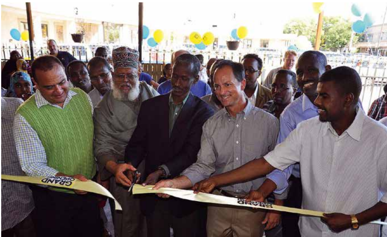
Sunrise Banks åpnet en mikrokredittavdeling i et somalisk kjøpesenter i det somaliske området i Minneapolis

ning ble lagt merke til på høyeste hold. Hvis det er én positiv utvikling, så er det dette: President Obama bevilget mer enn 104 millioner dollar i humanitær bistand til Somalia julen 2011/2012.