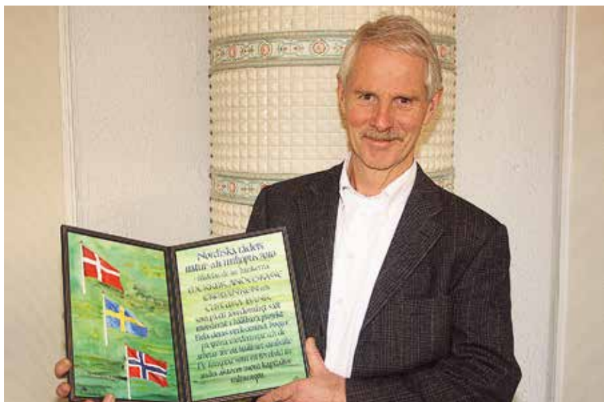
I 2010 fikk Cultura Bank Nordisk råds natur- og miljøpris, en viktig anerkjennelse av bankens rolle som forbilder.

Vi ønsker å oppfordre til en bevisst omgang med penger og kreditt, og hvis vi alle kunne begynne å reflektere over vårt forbruk og konsekvensene av dette, ville mye være vunnet. Økologi, fairtrade, en mer nøktern livsstil og kollektive løsninger er nøkkelord for å oppnå økt global rettferdighet og redusere vårt økologiske fotavtrykk. I dette bildet er Cultura Banks oppgave å drive en transparent, verdibasert bankvirksomhet, som sørger for at det finnes et banktilbud i Norge for mennesker som deler våre verdier.