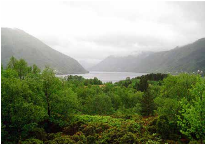
Osterøy kan by på vakker natur.

ket både å gå ut av gruppen og å komme tilbake igjen.