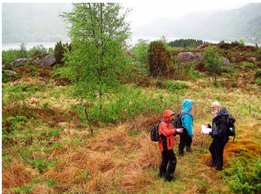
Befaring på tomten på Osterøy.

www.bergenokologiskelandsby.no e-post: info@bergenokologiskelandsby.no Facebook: Bergen Økologiske Landsby Facebook: Den Grønne Kafé i Marken