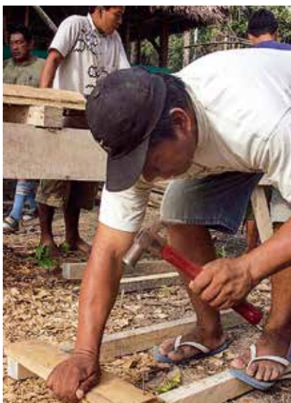
Snekker: Vaktposten blir en realitet etter et samarbeid mellom lokalbefolkning, regjering og Regnskogfondet.